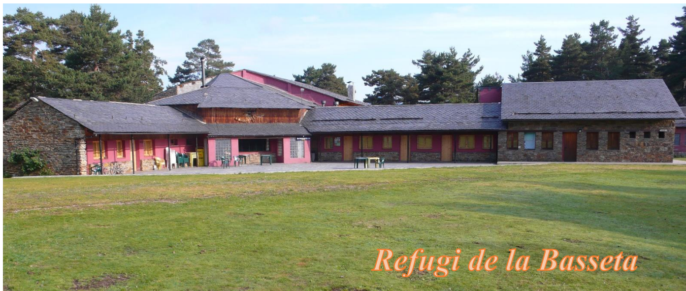
Refugi de la Basseta