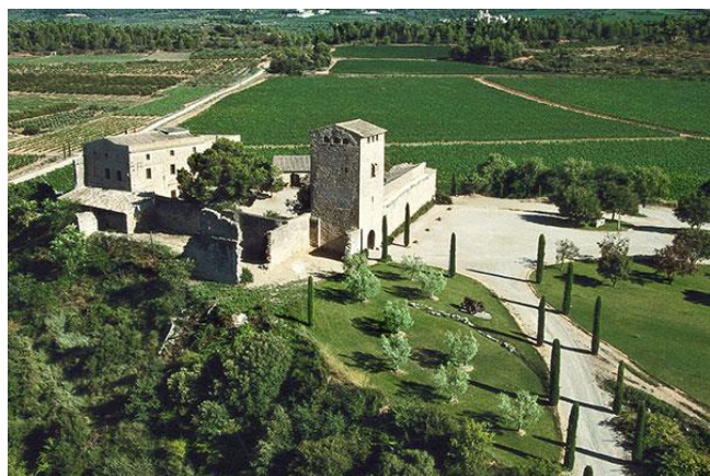
Castell de Milmanda