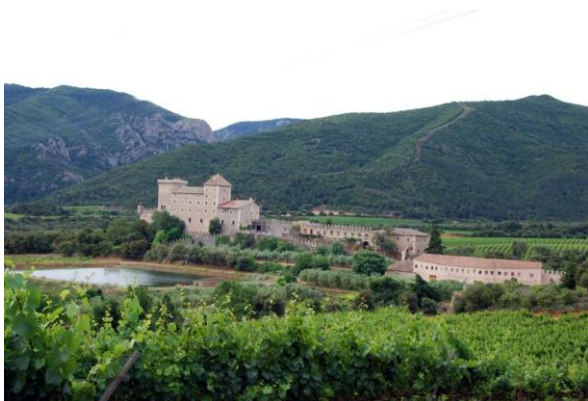
Castell de Riudabella

El Castell de Riudabella és una antiga granja cistercenca convertida en mansió fortificada d'estil historicista. S'assenta sobre una antiga vil·la romana i el segle XIII va ser explotada pels monjos de Poblet. Després de la desamortització fou adquirida per la família Gil Moreno i avui en dia es troba envoltada d'una gran extensió de vinyes.