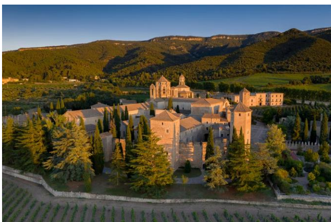
Reial Monestir de Santa Maria de Poblet

El 1921, després de la visita del rei Alfons XIII, va ser declarat Monument Nacional pel Govern Espanyol. El 1991 va ser declarat Patrimoni de la Humanitat per la UNESCO.