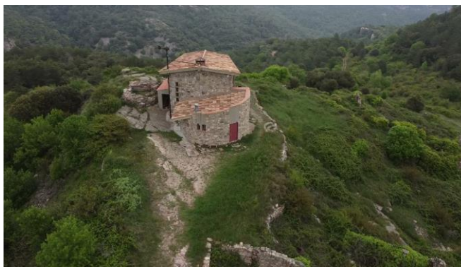
Refugi dels Cogullons