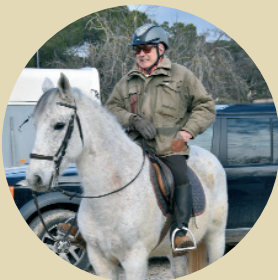
Picasso i Vicenç Brossa