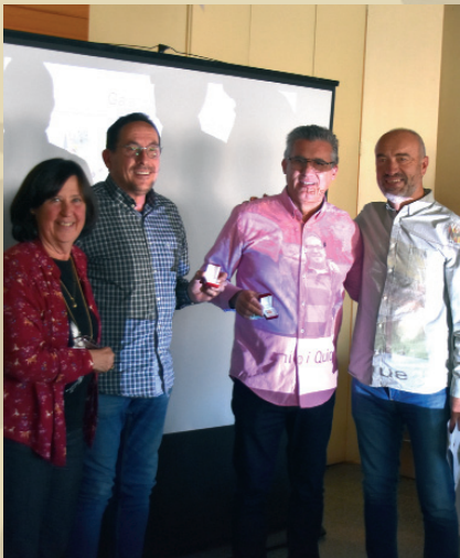
Bronze per E. Cervià i JA Verdoy.

PD: La "caixa de suggeriments" s'obrirà a la propera reunió de la Junta i l'AMAC espera poder-ne donar resposta.