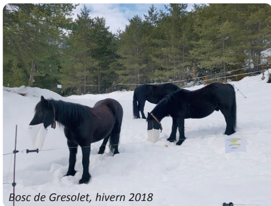
Bosc de Gresolet, hivern 2018

Després, per un canvi de circumstàncies de la vida, ens vàrem plantejar tenir cavalls nostres que fossin tranquils i que s'adaptessin a viure lliures, al ras, a la vall del Pedraforca. La seva climatologia d'hiverns rigorosos ens va fer decantar per una raça pirenaica, la dels Merens, que havia sobreviscut a les dures condicions de la Catalunya Nord i de l'Ariège i, a més, per la seva morfologia era molt adequada per rutes de muntanya (com uns 4x4). Després de 2 anys voltant pel sud de França, mirant criadors, demanant informació i llegint llibres, ens vàrem decidir. Quants dubtes havíem tingut!