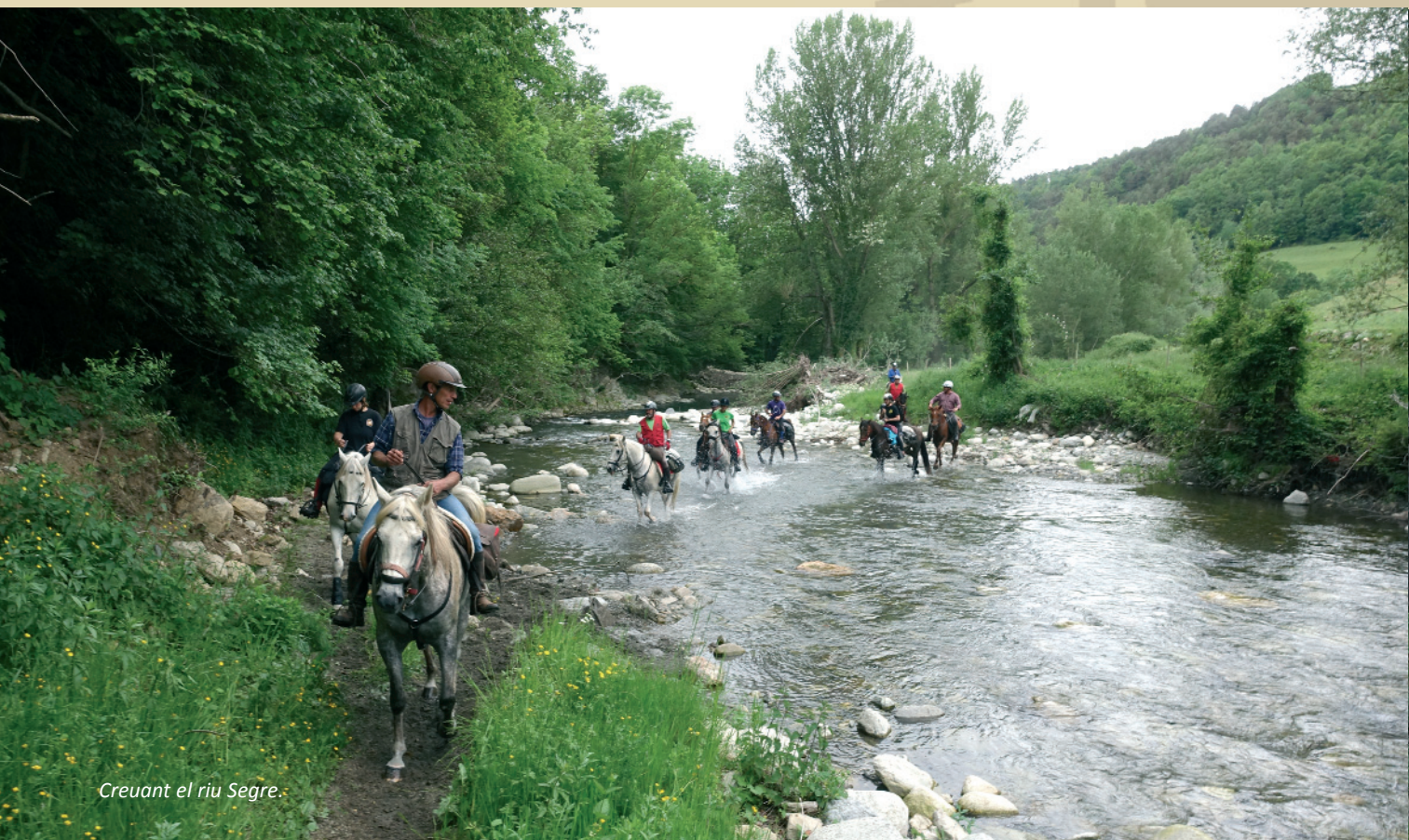
Creuant el riu Segre.

Amb estòmacs plens i descansats a mitges vam fer camí (amb alguna galopadeta controlada en grup petit) cap a l'hípcia on dormirien els cavalls i seguidament cap a la casa de colònies on ens allotjaríem en habitacions de 60. La nit prometia. Corredisses amunt i avall per ubicar el millor llit en l'habitació més adient i desembolicar sacs de dormir. He dit que en aquell moment ja m'havia tele-transportat als anys d'EGB i les excursions a la granja-escola? Entre dutxes i l'hora de sopar va haver-hi una mica de temps d'esbarjo per intentar encistellar la pilota de