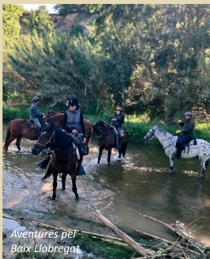
Aventures pel Baix Llobregat

muntanya i a seguir descobrint la zona. Just acabar de dinar, quatre gotes, quasi ni ens vam mullar i vam arribar al punt d'acampada perfectament dues hores després. A peu de riu, amb arbres i espai de sobres per a les cordades i les tendes. Llàstima que no era possible fer foc per poder explicar històries de por a la nit, ja, ja. Tendes muntades i sopa calenta que ens van portar a la zona d'acampada, ja... això no és gaire d'autonomia...però ja he dit abans que era "my way", en aquest cas dels dos organitzadors que ho tenien tot previst.