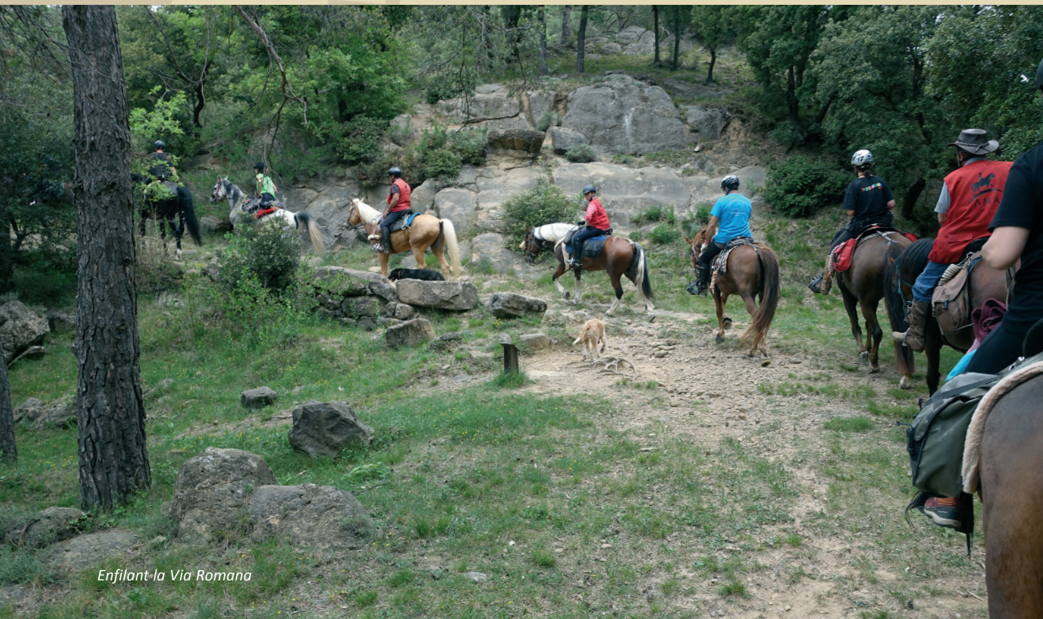
Enfilant la Via Romana

Des de Sant Salvador de Bianya, i quan ja podríem haver donat la ruta per finalitzada en qüestió d'anècdotes, encara ens quedava recórrer l'estrella de la jornada: la Via Romana de Capsacosta, un antic camí romà que fins a principis del segle XX comunicava la vall de Camprodon i la Garrotxa. Trepitjant pedres antiquíssimes vam anar ascendint a lloms dels nostres companys equins per aquest antic camí pedregós que ha vist al llarg de la història