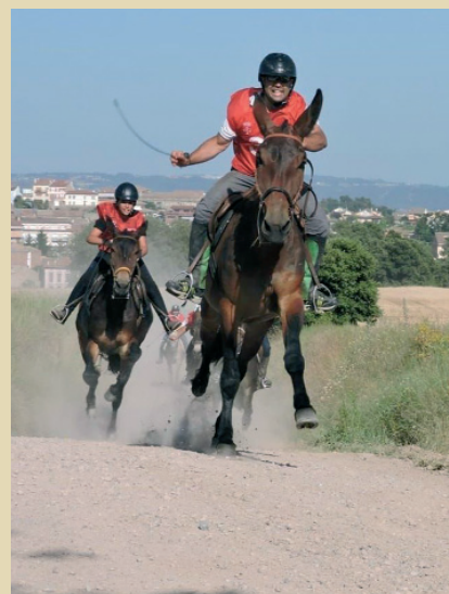
Cursa dels Elois