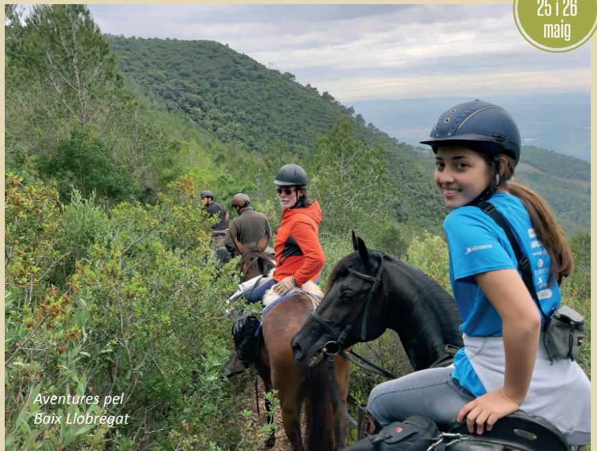
Aventures pel Baix Llobregat

La ruta em va encantar, érem 9 genets el primer dia, que feia que el grup fos de ritme àgil i que es pogués fer la distància en el temps previst, tot i haver de ferrar cavalls amb parada de rigor un parell de vegades, les pedres no van perdonar els cascos d'algun cavall, per sort, com sempre, en un "plis", arreglats en mig de la