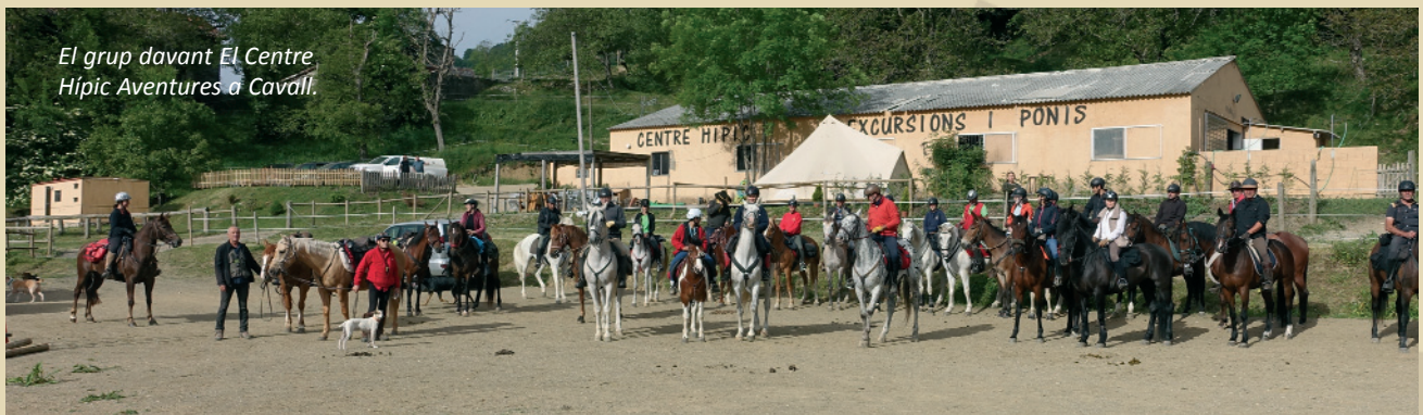
El grup davant El Centre Hípic Aventures a Cavall.