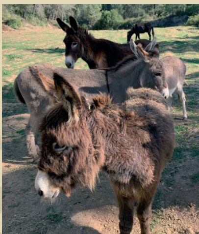
Sans i estalvis ...