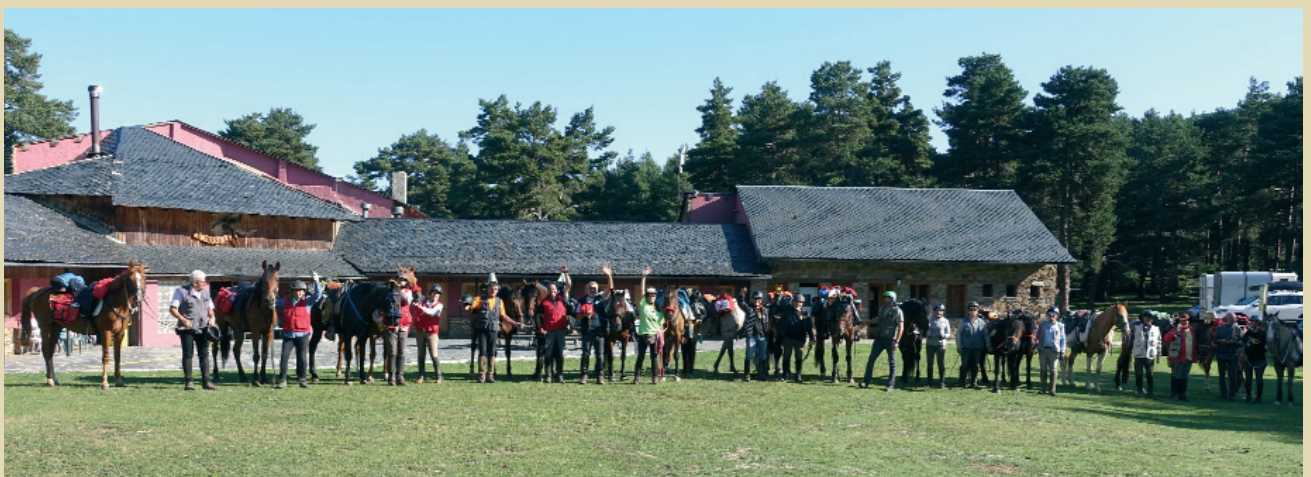
Refugi de la Basseta.

La baixada fins a la Seu d'Urgell no es fa tan llarga, suposo que pel bon regust del cap de setmana.