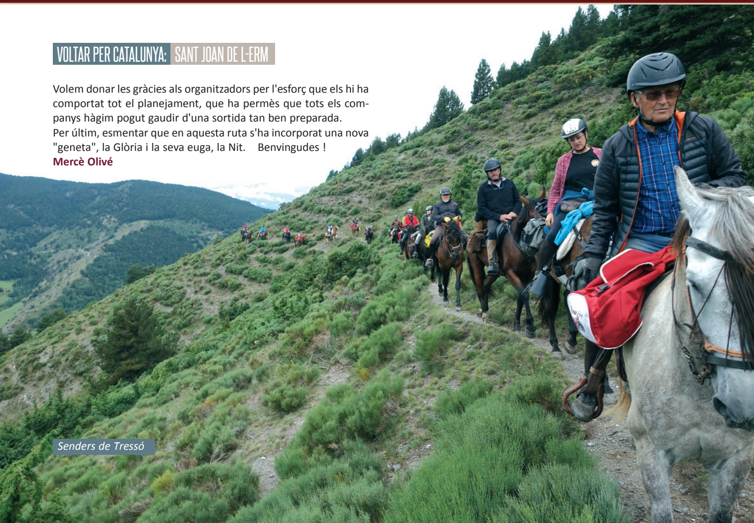
Senders de Tressó