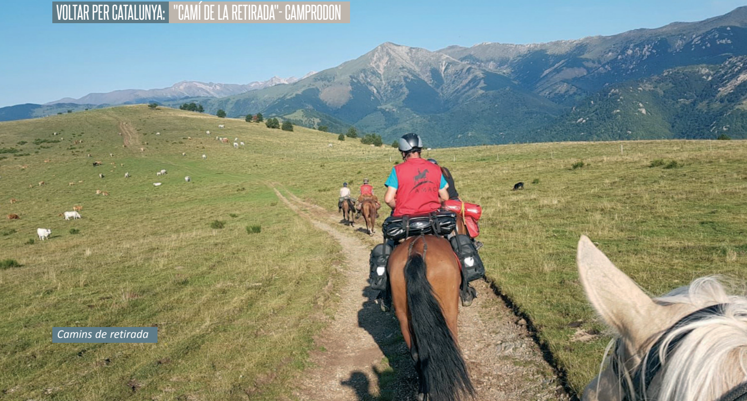
Camins de retirada