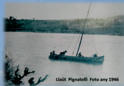
Llaüt Pignatelli Foto any 1946