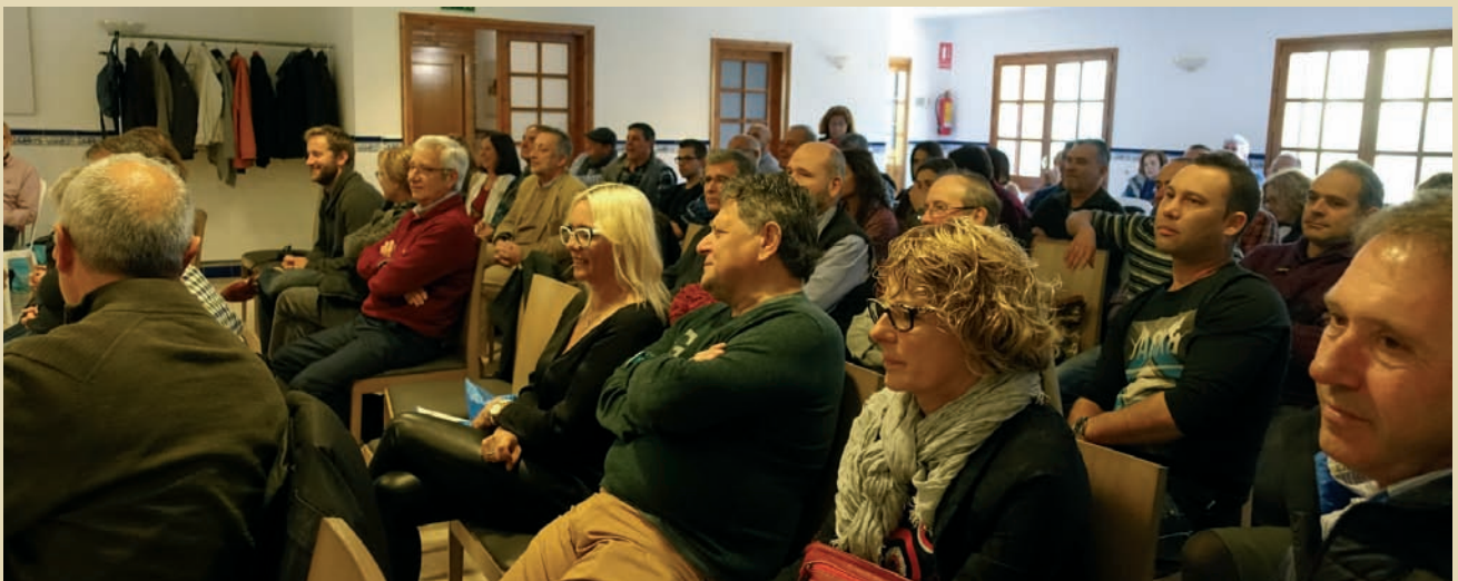
Escoltant amb atenció.