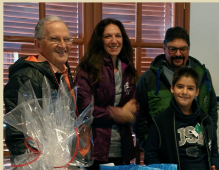
Els genets guanyadors.