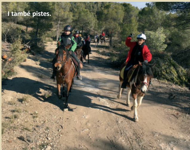
I també pistes.