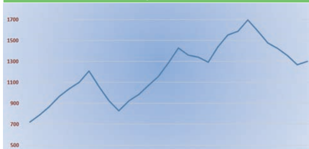
PERFIL DE LA RUTA DEL PRIMER DIA

Ara ens sorprèn una fageda increïble al vessant nord de la serra. El color verd brillant de les fulles dóna una llum diferent, les branques ens obliguen a ajupir-nos sobre les selles, el terra del camí d'argila vermella i fangós ens fa pensar en la possibilitat de perdre una ferradura, doncs ens enfonsem en els tolls fins quasi a