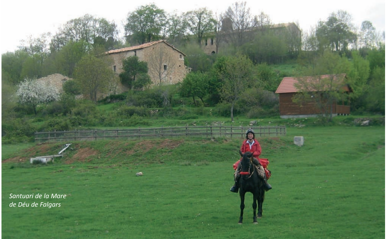
Santuari de la Mare de Déu de Falgars