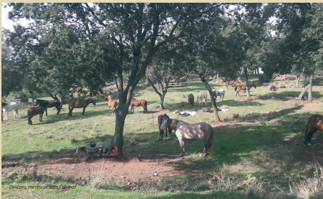
Descans merescut sota l'alzinar

Fa bon temps i la previsió és que serà així tot el cap de setmana, ja tenim molt de guanyat. Punt de trobada a l'esplanada gran que hi ha a mà dreta de l'entrada del municipi de Cànoves i Samalús. Anem a esmorzar al Forn El Racó de la Cris.