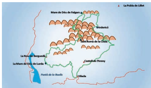
MAPA DE LA RUTA

Sortim de Vilada per una pista ampla que s'enfila primer cap nord-oest i després cap a nord, en direcció a les muntanyes que tenim davant. El camí és fàcil entre boscos espesos de pins i algun prat i fa que avancem ràpid. S'anomena el camí de la Clusa. Arribem a Can Comelles, una casa molt maca que és troba a la