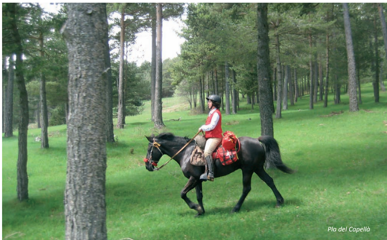
Pla del Capellà

El Santuari ha estat sempre un lloc de peregrinació. Té un karma especial i des del mirador es pot veure la muntanya "mítica" del Pedraforca. Fa més de 50 anys, s'hi arribava amb mules que llogaven els pagesos a l'estació de la Pobla de Lillet. Era una autèn-