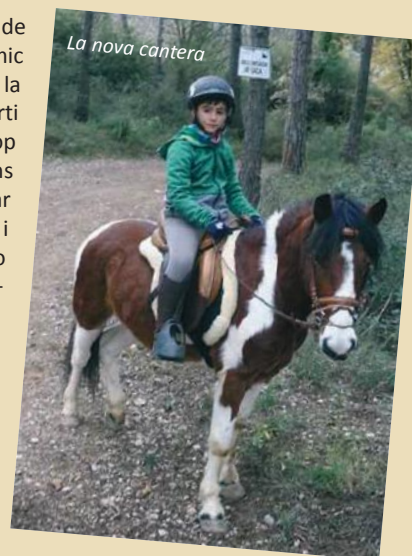
La nova cantera