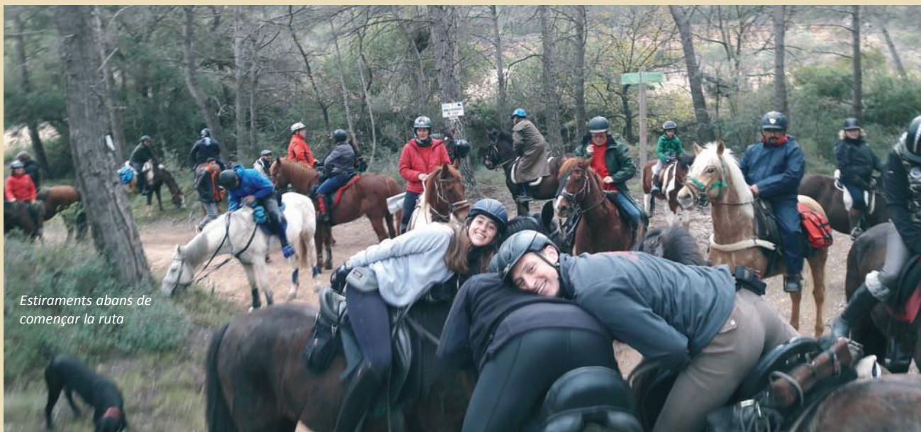
Estiraments abans de començar la ruta

Suposo que tothom està al cas, però pels despistats o els novells en aquest món de rutes, l'AMAC és l'Associació de Marxes a Cavall de Catalunya ... això és el concepte "formal" però, de fet, la realitat és que és un puzzle encantador de persones, de totes les edats, que ens trobem per passar una bona estona junts i amb els nostres cavalls.