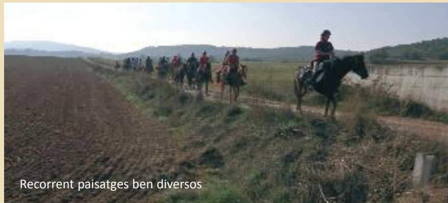
Recorrent paisatges ben diversos