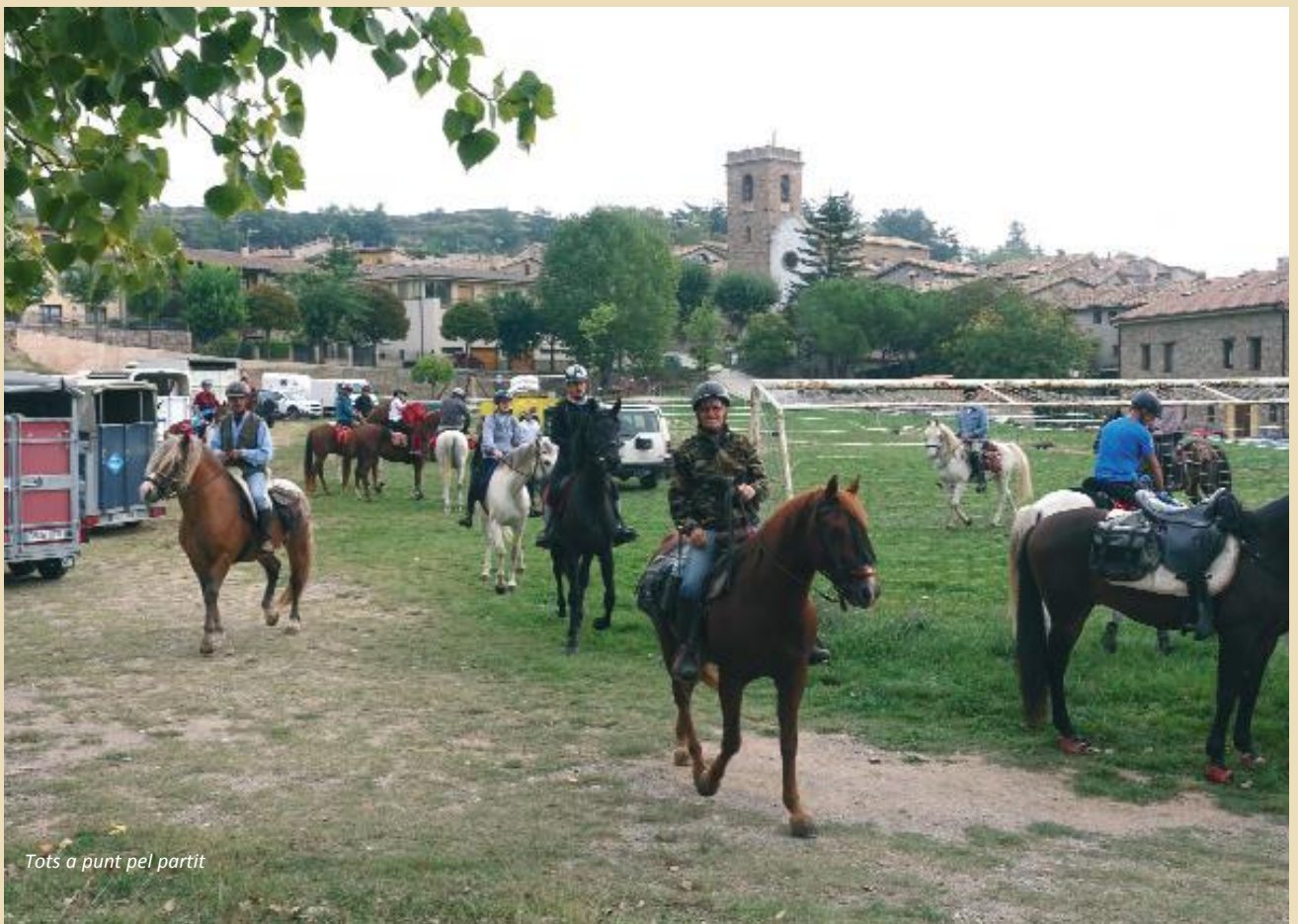
Tots a punt pel partit