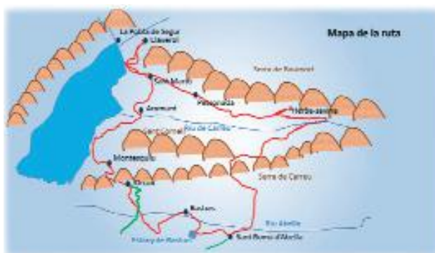
MAPA DE LA RUTA

Aparquem el remolc al carrer, prop de la parada del bus escolar que no funciona el cap de setmana (així ens ho han fet saber els "avis" del poble que també el vigilaran el cap de setmana, voluntàriament!). Sense problemes d'espai, ensellem el cavalls i col·loquem l'equipatge, el nostre menjar i el dels cavalls i comencem la ruta cap al desconegut. El dia és presenta assolellat. A la sortida del poble ens acomiada l'ermita de Sant Pere Màrtir del segle XI, posada damunt del camí.