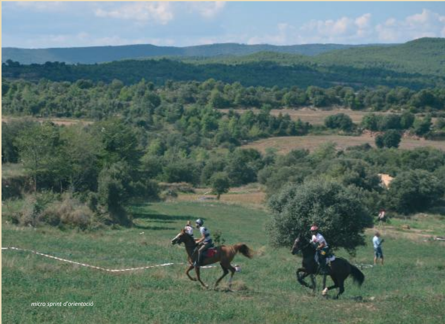
micro sprint d'orientació

orientació i alhora per posar a prova les capacitats físiques i mentals dels participants. Es tracta de trobar tots els punts que venen marcats en un mapa que facilita l'organització, amb el mínim de temps possible i es practica en un espai reduït i clarament delimitat (en el nostre cas, varem escollir uns camps de conreu disposats en feixes de diferents nivells). És tracta d'una prova de curta durada en la qual les dificultats del terreny i els diferents elements artificials (tanques i cintes) que s'hi col·loquen obliguen els participants a estar molt atents en tot moment al mapa per decidir quin és el millor camí per arribar a cadascun dels punts.