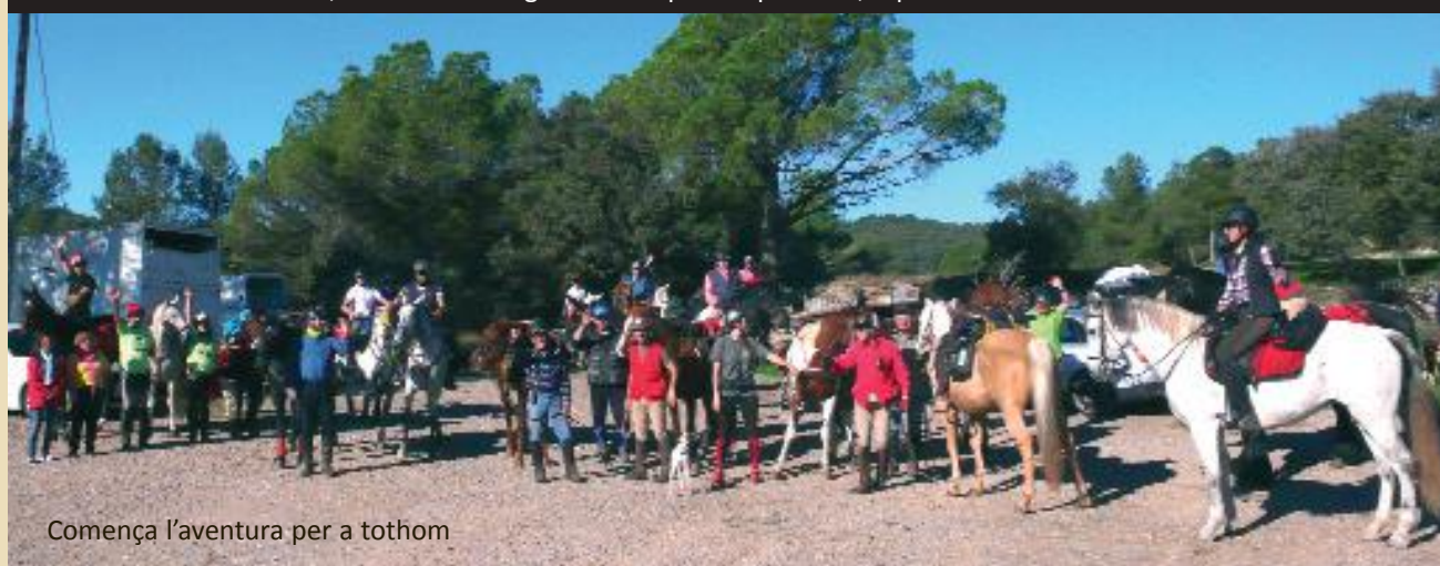
Comença l'aventura per a tothom

Dit això, i com una imatge val més que mil paraules, aquí teniu el Cavall de Ferro: