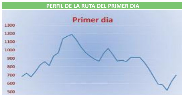
PERFIL DE LA RUTA DEL PRIMER DIA

El camí segueix ample, planejant i, envoltat de boscos al peu de la muntanya de Sant Corneli. En travessar el barranc de la Podega tocant al pantà, la pista s'enfila cap a Montesquiú. El mapa ens marca una font on pensem dinar, la calor es deixa notar i la pista ben assolellada fa pujada. Abans d'arribar a Montesquiú, ens trobem l'ermita de Sant Serní, una capella molt senzilla del romànic rural del segle XII. Parem i la visitem, és una preciositat, amb uns frescos molt bonics a les parets que, pel seu estat d'abandó, aviat serà una ruïna. Sempre és trist veure com aquests petits tresors estan condemnats a desaparèixer.