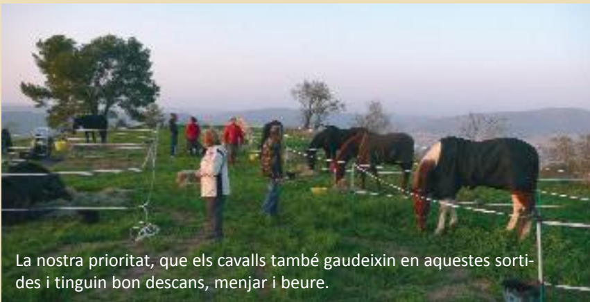
La nostra prioritat, que els cavalls també gaudeixin en aquestes sortides i tinguin bon descans, menjar i beure.