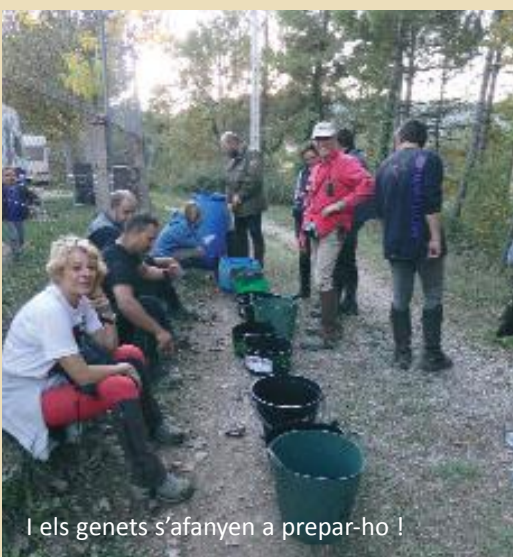
I els genets s'afanyen a preparar-ho !