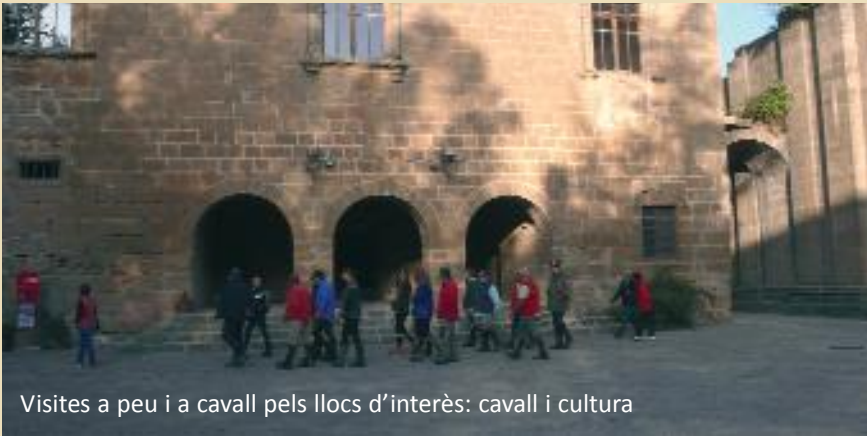
Visites a peu i a cavall pels llocs d'interès: cavall i cultura