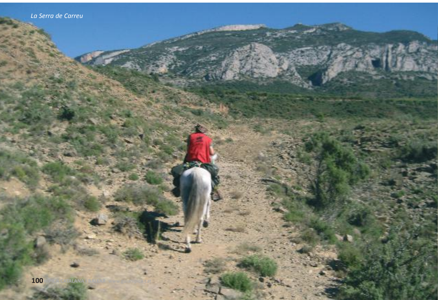
La Serra de Carreu