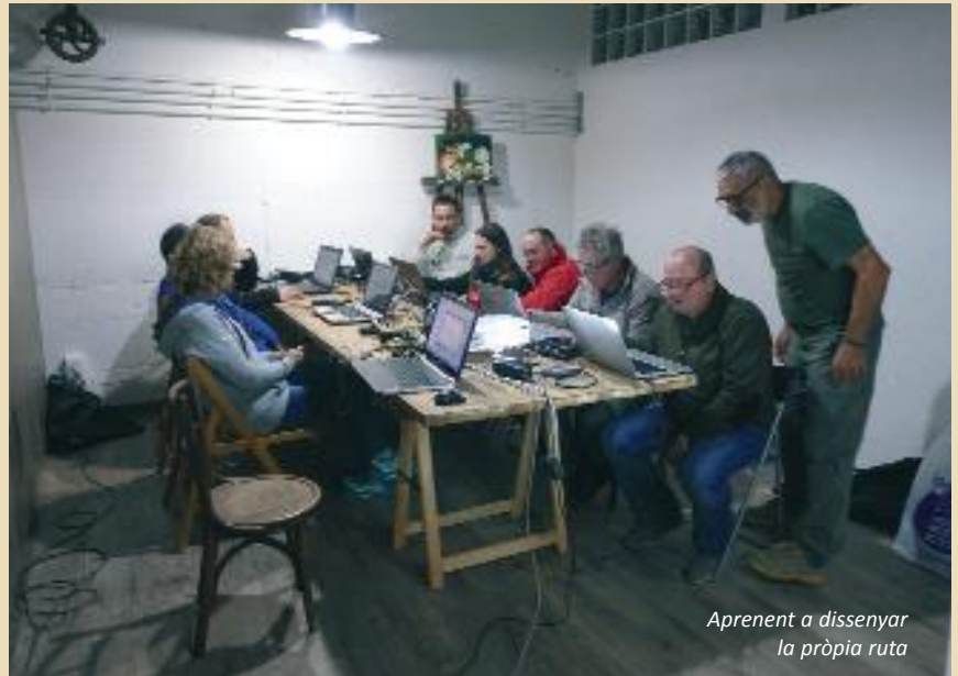
Aprenent a dissenyar la pròpia ruta

Degut a l'interès que han expressat els socis, estan previstos dos cursos més els dies 28 i 29 de gener 2017.