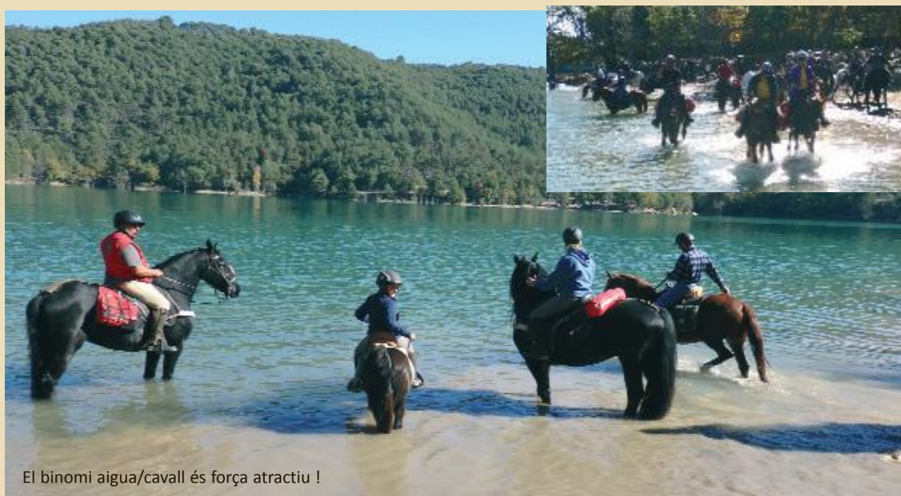
El binomi aigua/cavall és força atractiu !