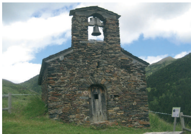
La Mare de Déu de la Salut