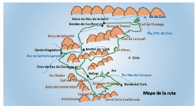
MAPA DE LA RUTA

A Ars podeu trobar allotjament en una casa rural si voleu arribar-hi el dia abans. Els cavalls estarien en un prat, millor si porteu tancat elèctric. El tancat elèctric és aquella peça imprescindible per fer rutes a cavall, (si es du cotxe de recolzament) que quan es du quasi mai no s'utilitza, i quan no es du, sorgeixen múltiples ocasions d'utilitzar-lo!