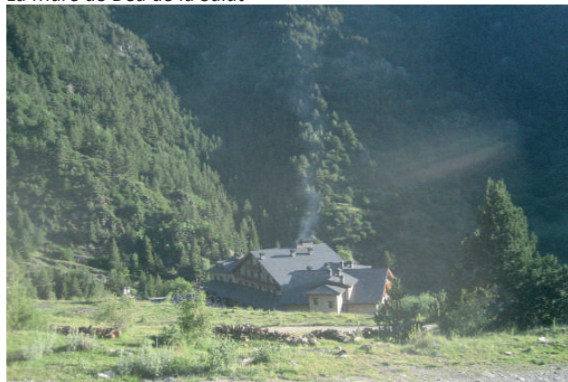
Hotel Os de Civís