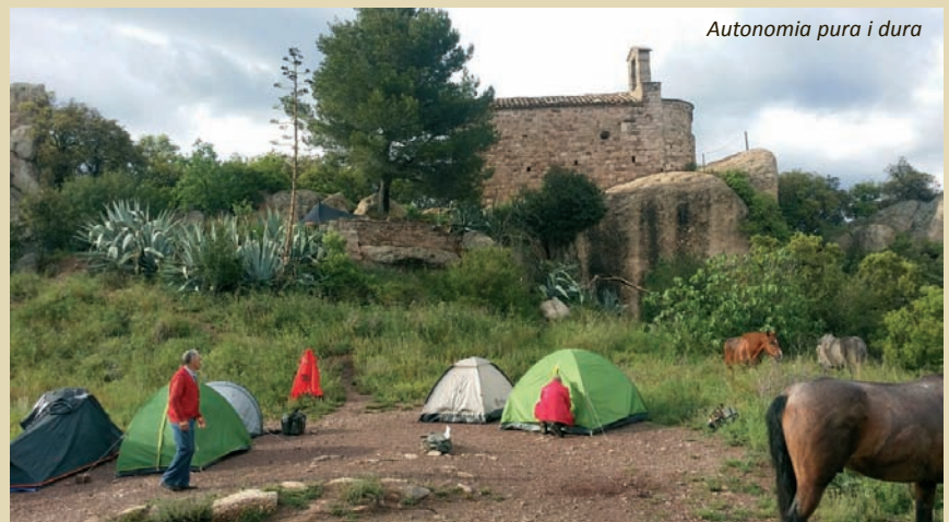
Autonomia pura i dura

Aquell cap de setmana és per fer anomenada i per recordar, doncs, a partir de llavors he conegut el gaudi de compartir sensacions amb altres cavalls i genets socis de l'AMAC. S'ho val, tota ajuda a obrir horitzons per noves terres i agafar experiència i seguretat per arribar a nous cims sempre amb bona companyia que et fa costat en tot moment.