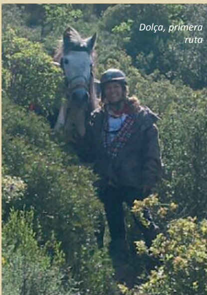
Dolça, primera ruta