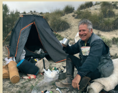
Àlex, es necessiten poques coses

7è dia: Los Rabotes, Benamaurel, Barranco del Salar, Cortijo Don Rodrigo Diaz de Vivar, (HOYA DE BAZA- EL SALAR)