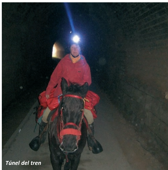
Túnel del tren

A la dreta veiem l'ermita de Sant Josep dalt d'un turó, abans d'entrar al congost del riu de La Canaleta, i en una hora trobem l'estació de tren de Prat de Compte i poc després el santuari de La Font Calda, petit balneari fundat pels monjos trinitaris el segle XIV. L'aigua de la font surt a una temperatura de 38°C i té