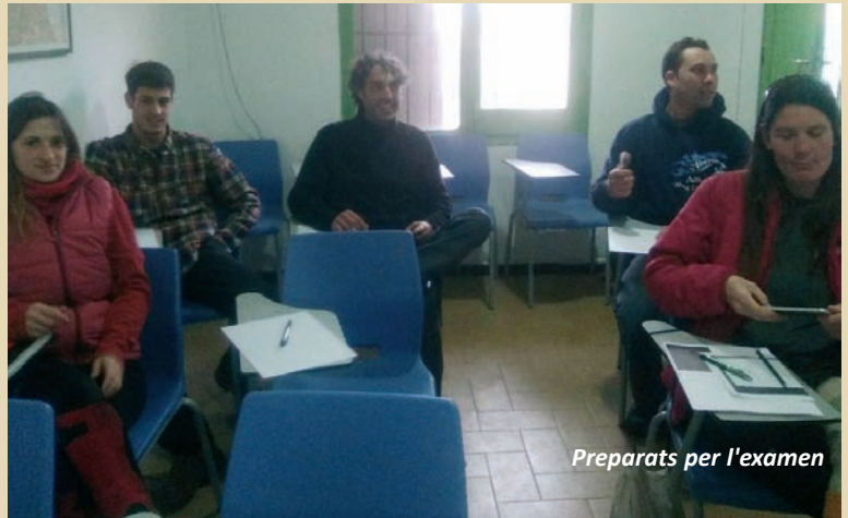
Preparats per l'examen