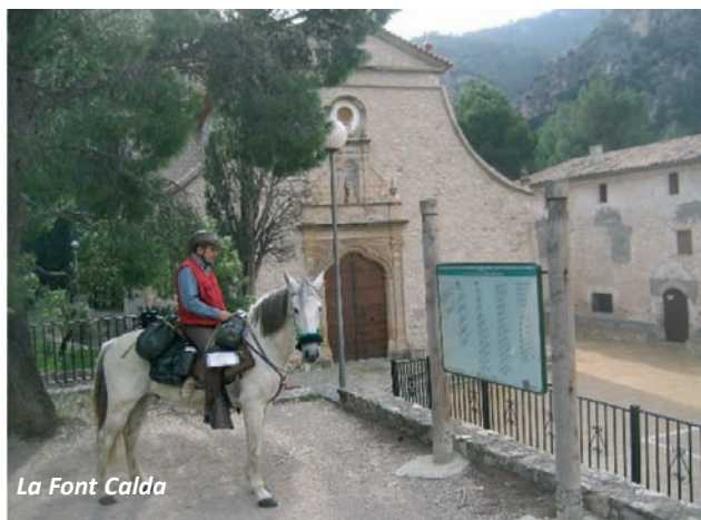
La Font Calda