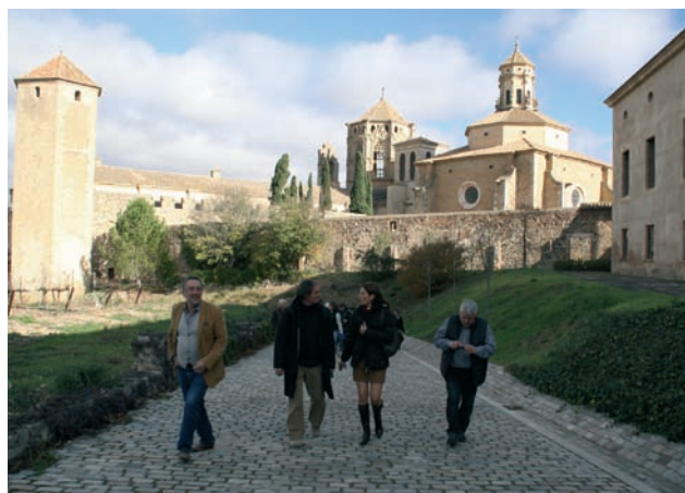
Momento durante la visita guiada al Monasterio de Poblet.