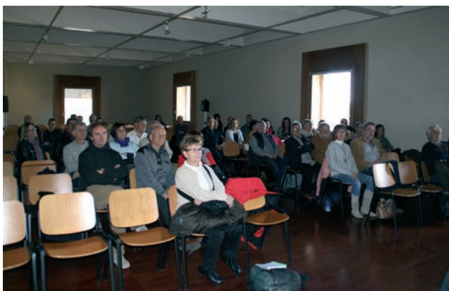
Vista de la sala durante la asamblea