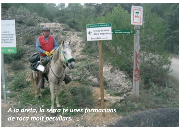
A la dreta, la serra té unes formacions de roca molt peculiars.