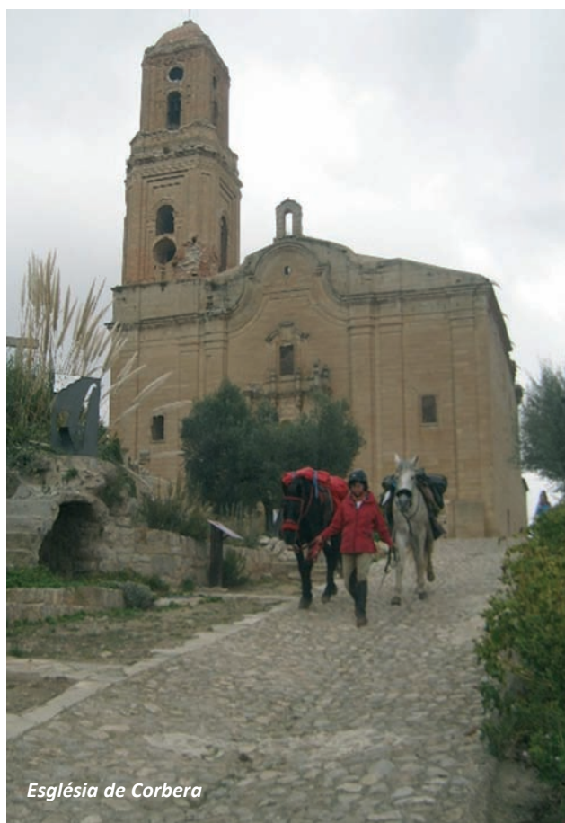
Església de Corbera

Quan veiem el poble de Bot, aproximadament al quilòmetre 32 del recorregut teòric, la Via Verda queda sota nostre. És el moment de controlar el track ja que haurem d'abandonar el camí ample i agafar un corriol pel costat d'uns conreus i baixar a la Via Verda. No és cap problema si se segueix pel camí principal, es fa una mica de volta i se surt a la carretera a un quilòmetre del poble.