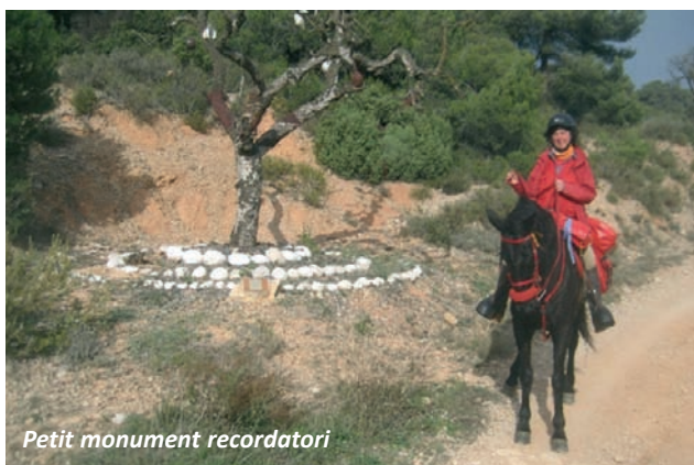
Petit monument recordatori