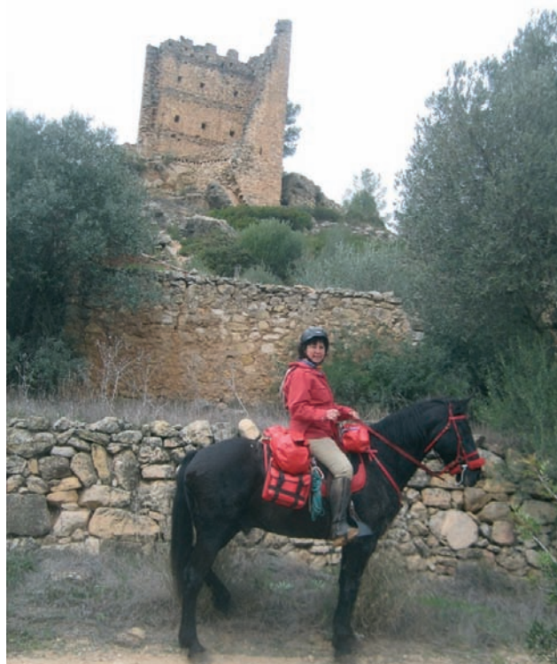
Torre de Cervelló

Seguim pel camí del Mas de l'Alvarés envoltats d'oliveres mil·lenàries, cada arbre és una autèntica escultura i una lliçó