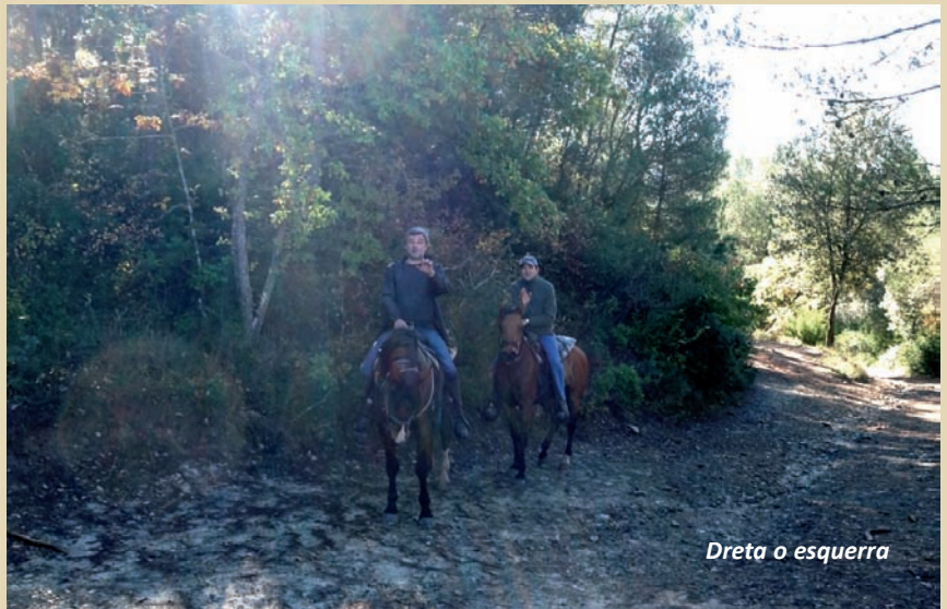
Dreta o esquerra

L'endemà, ben descansats, reprenem la ruta de tornada, cap a la Masia Abadal, a l'Horta d'Avinyó. La ruta del segon dia ens porta de baixada al llarg de la riera d'Oló. Avancem pel marge de la riera, travessant-la en algunes ocasions, on el recorregut transcorre per una franja de bosc de ribera restaurat, contemplant antigues vinyes.