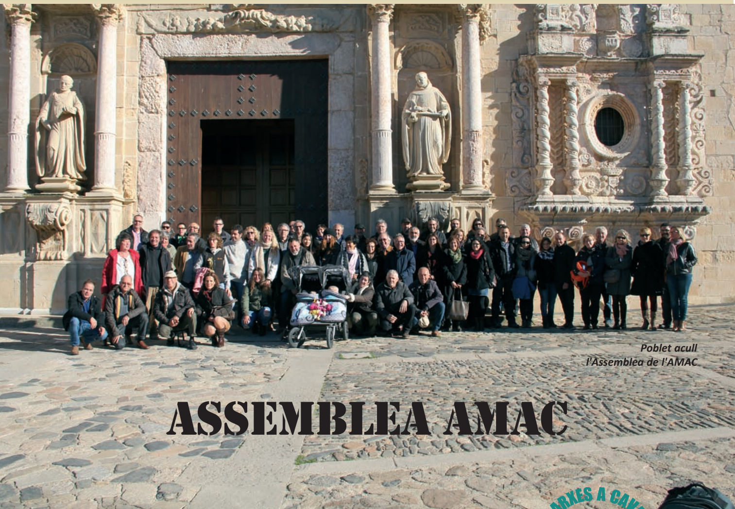
Poblet acull l'Assemblea de l'AMAC