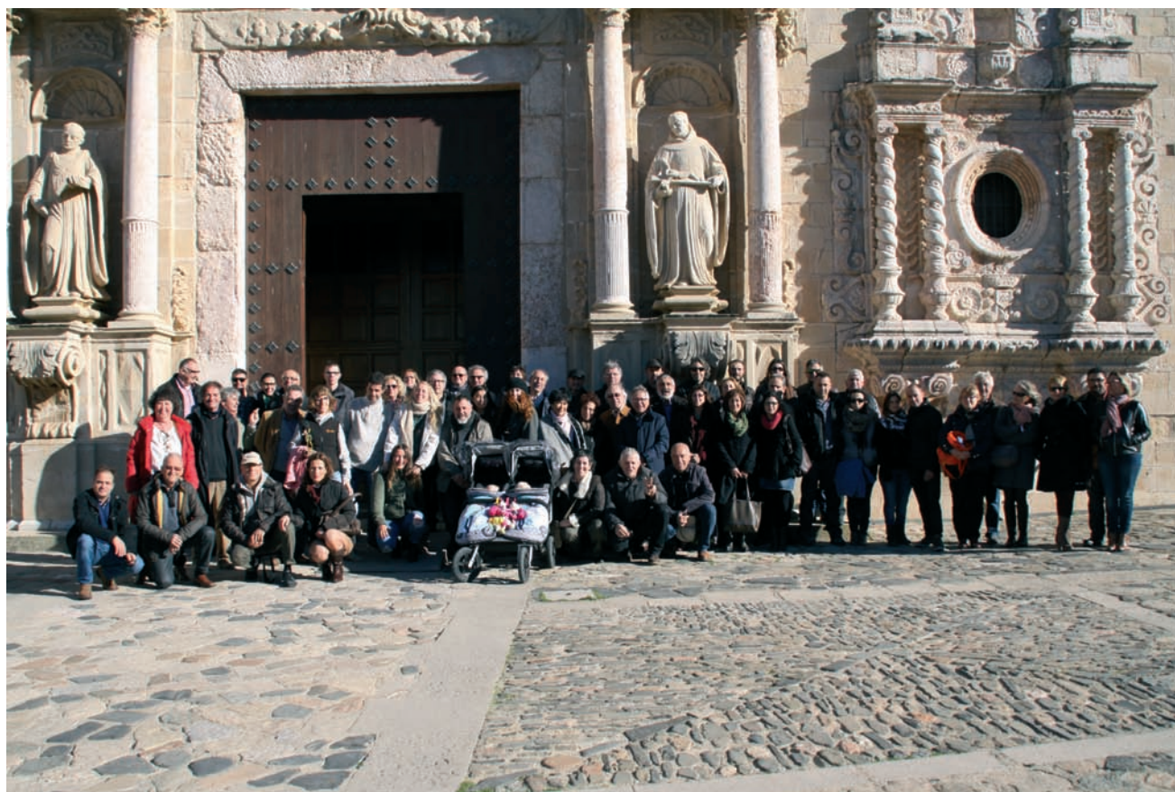
Foto de los asistentes a la asamblea en el patio del Monasterio de Poblet