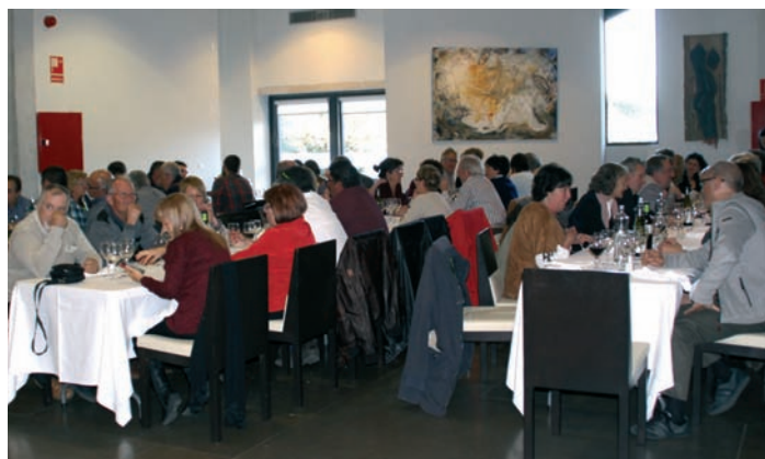
Asistentes durante la comida en el restaurante