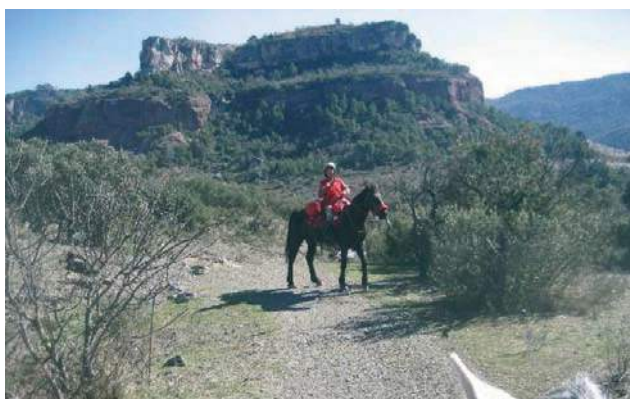
Vista de Siurana

les fulles aquell color vermellós tan característic i, poc després, deixem el camí principal i ens enfilem per l'antic camí de ferradura cap el coll de Poboleda que ens mostra clarament com de dura era la vida per les mules, matxos i ases que hi transitaven cada dia. Està marcat en groc fins al poble de Poboleda, també Priorat històric, i en arribar a dalt del coll, tenim una visió completa de la Serralada del Montsan. Aquesta muntanya "santa i màgica" de la comarca i poc coneguda a Catalunya es presenta davant nostre amb tota la seva façana més espectacular. Val la pena aturar-se uns moments per contemplar-la i deixar també que els cavalls puguin descansar. Iniciem la baixada cap al poble, però abans d'arribar-hi, ens trobem el Siurana, riu que retrobarem més endavant. Normalment, el mes d'octubre, el riu porta aigua i podrem abeurar els cavalls sense problemes.