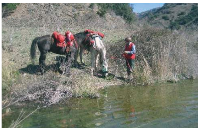
Pantà de Siurana