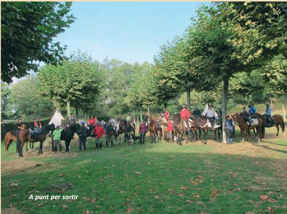
A punt per sortir