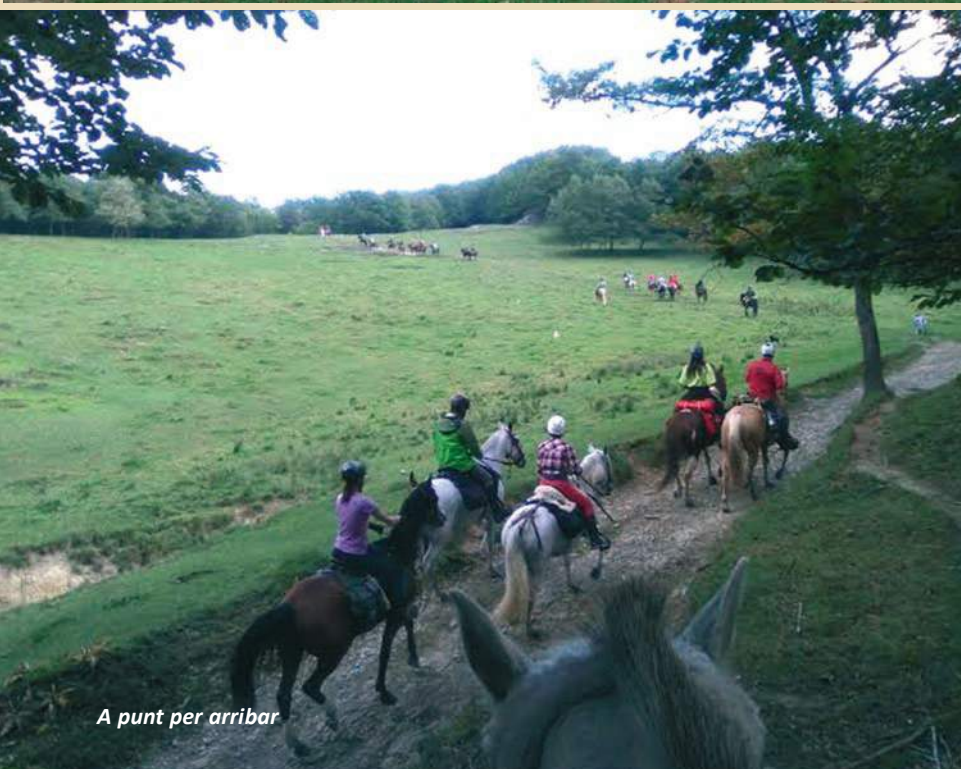
A punt per arribar