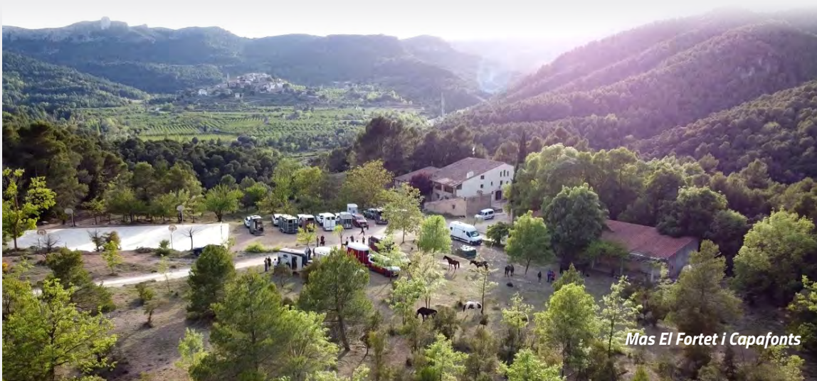
Mas El Fortet i Capafonts